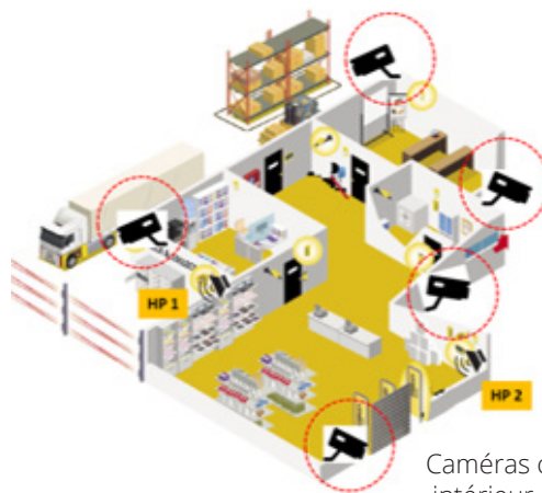
Caméras connectées intérieur / extérieur